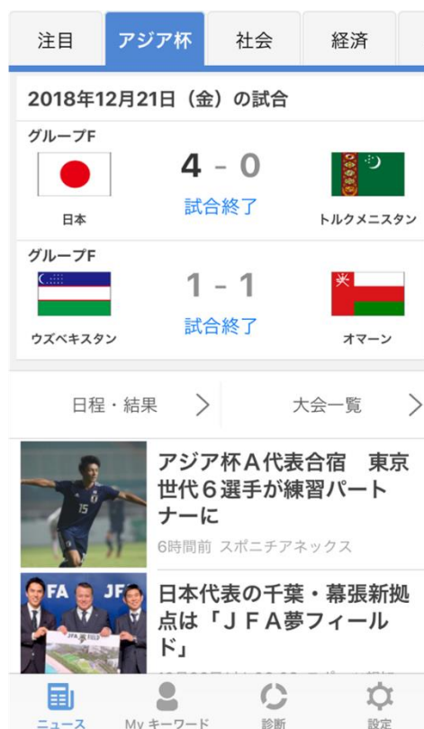
アジア杯特設タブ