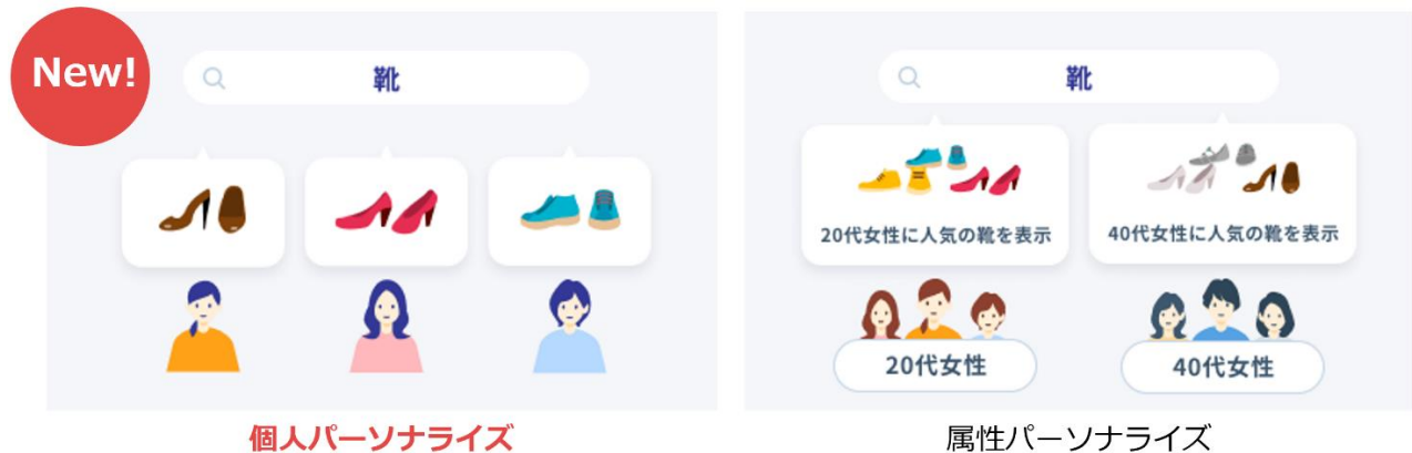
パーソナライズ検索の種類

「個人パーソナライズ」と「属性パーソナライズ」、2つのパーソナライズ検索の手法が揃ったことで、ECサイトごとの特性や細かなニーズに合わせて検索機能を提供できるようになりました。「goo Search Solution」は「パーソナライズ検索」の提供を通じて、ECサイトの利便性向上に貢献します。