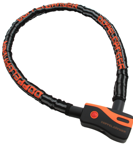
ウルトラアーマードアラームロック DW-06

DOPPELGÄNGER® SHOCK THE PEOPLE ショックザピープル