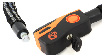
キーホールシステムつきシリンダー錠