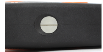
キーホールシャッター付き