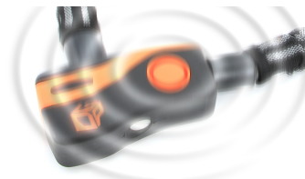
最大 96 デシベルの警告音