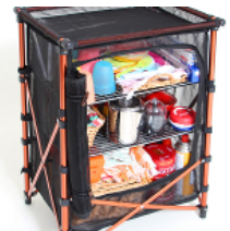
③メッシュラックとして