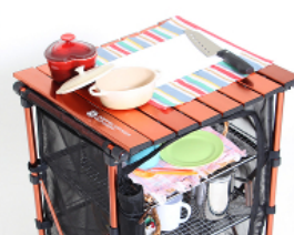
②キッチンテーブルとして