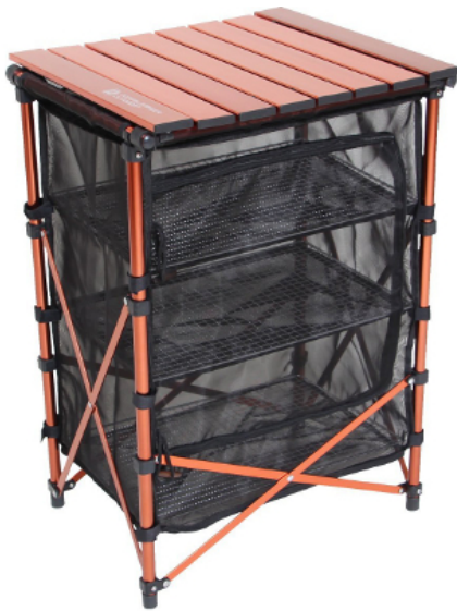
3wayドライネットテーブル TB2-252