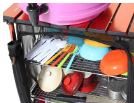
①水切りラックとして