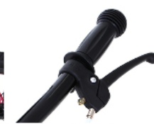
周囲を傷つけにくいグリップと 安全な乗車を習慣付けるブレーキ