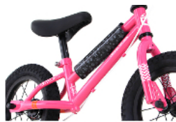
スチール製 オリジナルフレーム