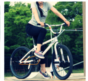
家族で、兄弟姉妹でお揃いのデザイン！成長に合わせて選べるDXシリーズ