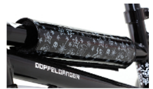
お子様の安全を守る フレームパッド