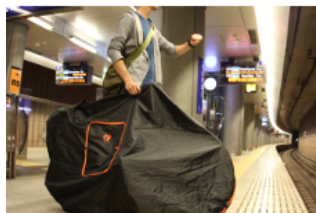
輸行で愛車を持ってくるか、100km自力で走行して・・・

CYCLE MODE international 2014 自転車で來る人 応援キャンペーン!