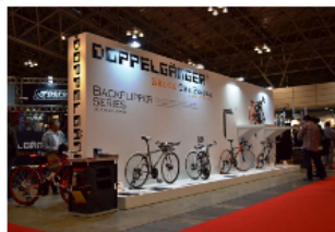
DOPPELGÄNGER®ブース (No.2-25) に來れば・・・