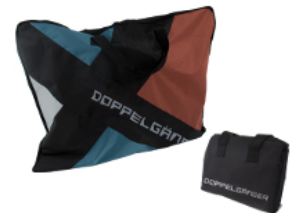
輸行キャリングバッグ DB-3を プレゼント!

【名称】CYCLE MODE international 2014 【会場】幕張メッセ 1~4ホール 【ブース No.】2-25 【日時】11月7日(金) 10:00 ~ 18:00 11月8日(土) 10:00 ~ 18:00 11月9日(日) 10:00 ~ 17:00