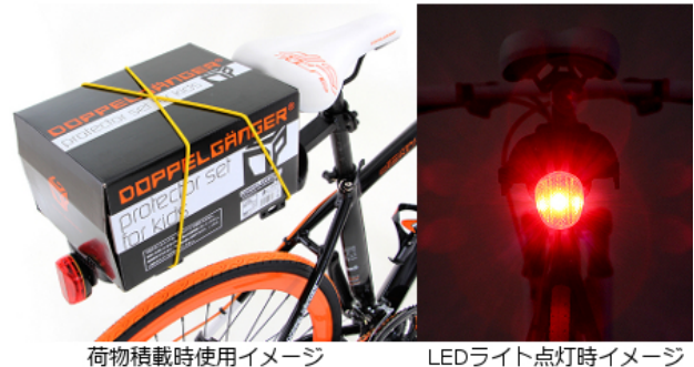
荷物積載時使用イメージ