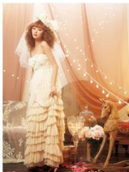
PARCO × fur fur × ClifO mariage