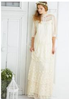
Balcony and Bed