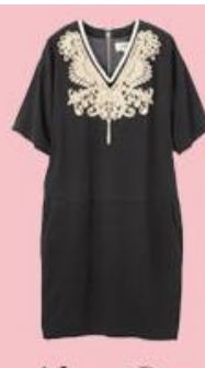
Adam et Rope