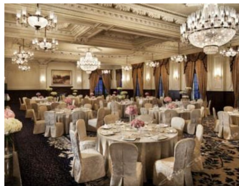
< バンケット >