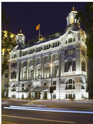
< ホテル外観 >

◆ 歴史ある著名ホテル「ウォルドルフ アストリア」との提携により、お客様に最高級のサービスを提供 この度T&Gが業務提携した5つ星ホテル「ウォルドルフ アストリア 上海 オンザバンド」は、国際的に有名なヒルトングループが最高峰ブランドとして2010年4月にアジアに初めてオープンし、運営をしております。また建物は、1910年に建てられた壮麗なゴシック様式の上海總會 (Shanghai Club)を改装しており、旧世界の魅力とモダンなデザインの融合が見て取れる造りです。ホテルの備え持つ上質な空間とT&Gがこれまで培ったプロデュース力を掛け合わせ、お客様に最高級のサービスを提供いたします。