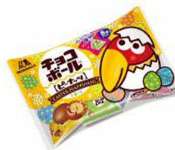
▲チョコボール<ピーナッツ>テトラ袋