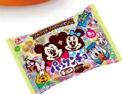
▲パクンチョコ<チョコ>テトラ袋