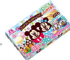
▲チョコ玉パクンチョコ<プリン味>