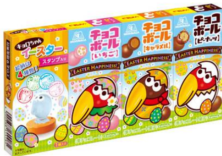
▲キョロちゃんイースター