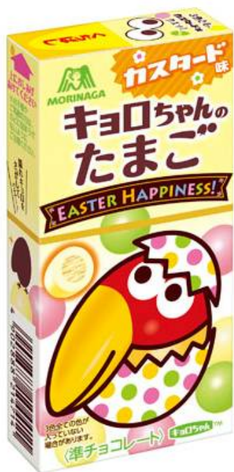
▲キョロちゃんのたまご<カスタード味>

森永製菓は、菓子と親和性の高い「イースター」に注目し、新商品を発売することで日本の「イースター」を盛り上げてまいります。