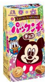
▲パクンチョコ<チョコ><いちご>