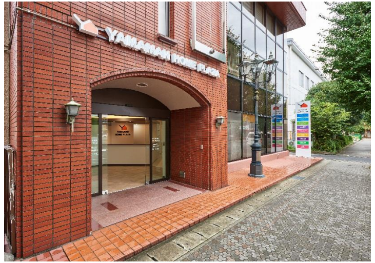
▲山万ホームプラザ八千代台店

「山万ホームプラザ八千代台店」は、山万がユーカリが丘エリア外で本格的に多店舗展開を目指す不動産売買・リフォーム複合店舗の1号店であり、不動産売買、リフォームなど不動産に関するご相談を一度に解決するワンストップサービスを提供致します。