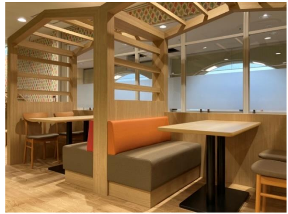
ワーク・お食事ゾーン