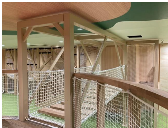
シンボルツリー・吊り橋ゾーン