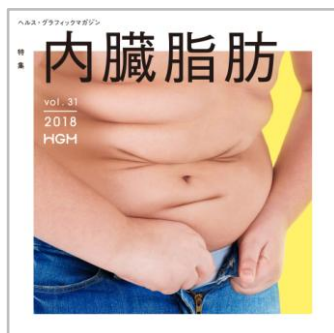
「ヘルス・グラフィックマガジン」 Vol. 31 「内臓脂肪号」の表紙