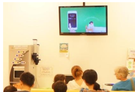
デジタルサイネージ「ヘルスケアビジョン」

「ヘルス・グラフィックマガジン」の最新号となる10月15日発行「内臓脂肪号」は、本キャンペーンの情報提供施策の中核となります。情報提供を担う、もう一つの施策が「ヘルスケアビジョン」の活用です。これは、社外拠点を含む全国700拠点以上に配信される調剤薬局業界最大級のデジタルサイネージネットワークです。本キャンペーンでは、テーマに基づいて制作した動画コンテンツによる情報提供をいたします。