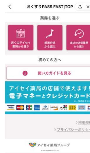
トップ画面イメージ

■おくすり予約サービス「おくすり PASS FAST」の詳細はこちらをご覧ください。