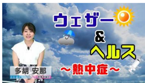
「ウェザー&ヘルス(熱中症編)」(協力：株式会社ウェザーマップ)