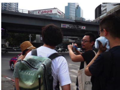
バンコクでのリサーチの様子