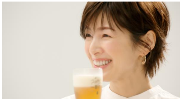
新TVCM「一番搾りだから」篇より