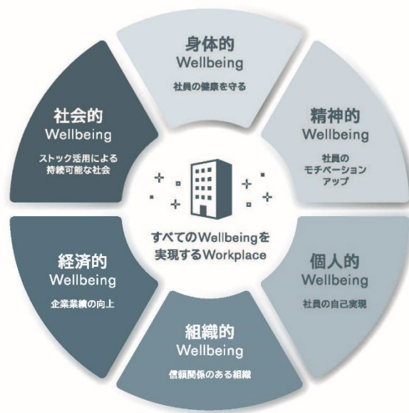
「W2/Wellbeing Workplace™」のコンセプト。 すべての「Wellbeing」の実現を目指す