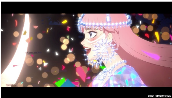
ANREALAGE NFT に含まれるデータの一部

なお、10 月 17 日 (日) から 24 日 (日) にかけて、NFT マーケットプレイスの最大手である OpenSea において、パリコレで披露したなかから未販売のデジタル作品のパブリックオークションをおこないます。今 NFT にもコレクションが生まれるまでの軌跡が記録されており、購入者は作品にまつわる一貫したストーリーの鑑賞体験をお楽しみいただけます。