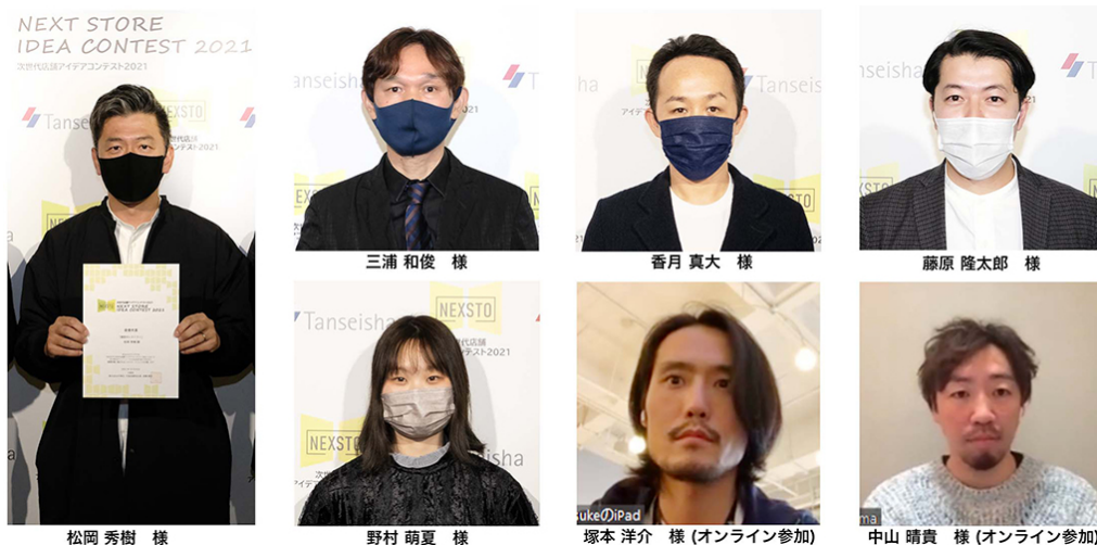
表彰式にお集まりいただいた受賞者のみなさま（一部オンライン参加）