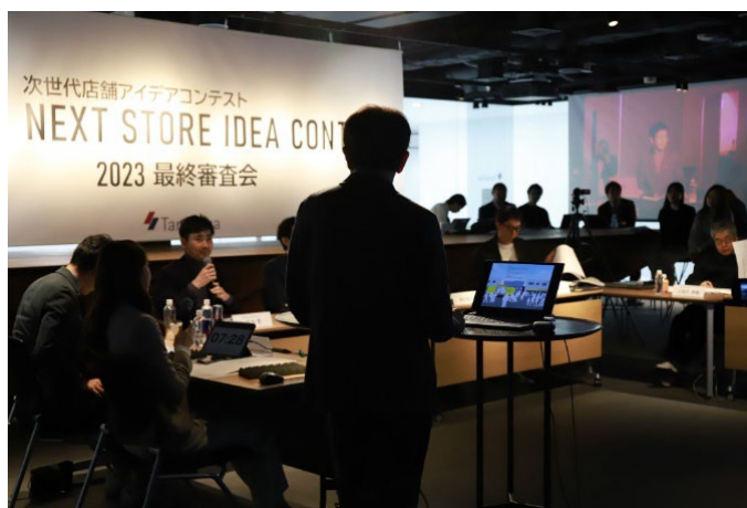
昨年のコンテストの最終審査会の様子

本アワードは、新たな才能と空間づくりのプロフェッショナルたちが出会い、そのポテンシャルやミライ空間の在り方を、ともに考える協創フィールドです。商業施設、小売店や飲食店等の丹青社のクライアントを審査員に迎え、丹青社のデザイナーらとともに、デザインやアイデア、可能性を多角的視点から審査することで、さまざまな方にこれからの空間づくりについて考える機会を創出します。