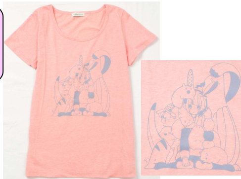
meisaさん描き下ろしイラストTシャツ

価格 : ¥2,992(税込) カラー : レディース(ピンク/ネイビー) メンズ(ホワイト/カーキ) サイズ : フリーサイズ