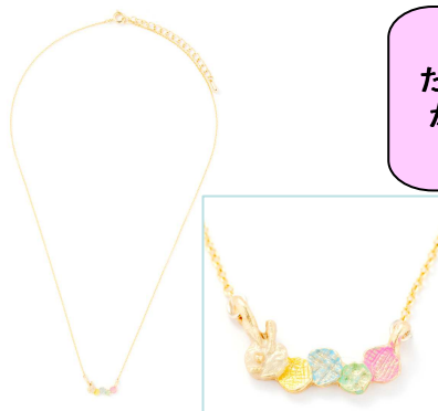
はらぺこあおむしのねっくれず

価格 : ¥1,995(税込) カラー : ゴールド/シルバー サイズ : フリーサイズ