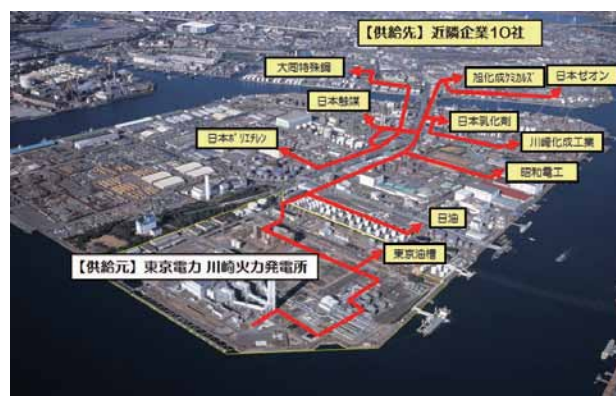
川崎スチームネットの蒸気供給配管網

代表的な事例としては、発電に使用した後の蒸気を近隣企業へ供給して再利用する「川崎スチームネット」事業があります。これにより大規模な省エネルギーが可能となり、平成24年度には年間