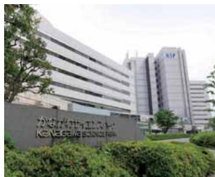
かながわサイエンスパーク