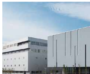
殿町区域（キングスカイフロント）