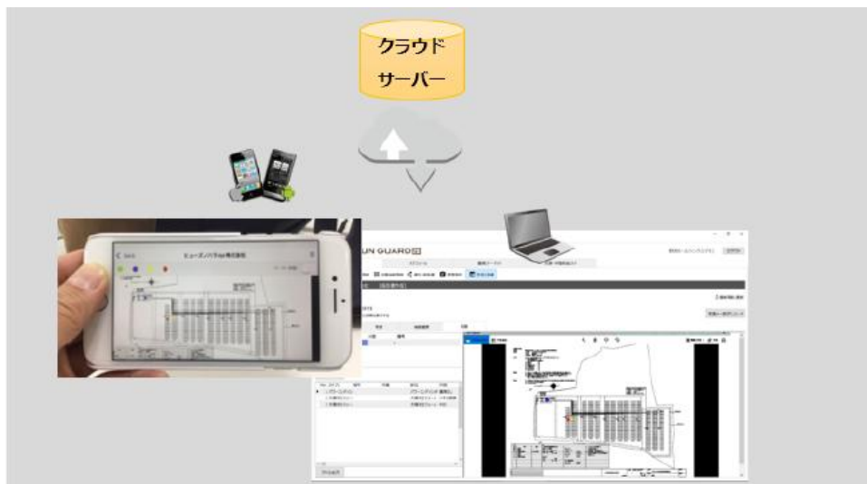
現場スマートフォン・タブレットとの連携