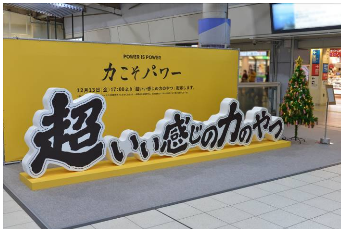
【超いい感じの力のやつ】