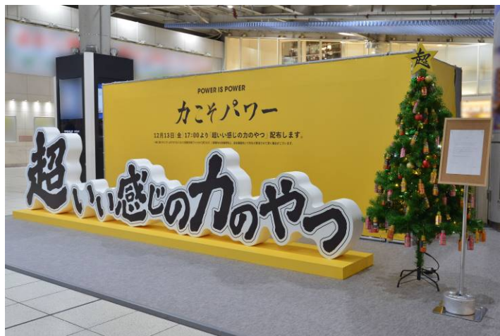
今回リニューアルした巨大モニュメント（JR 品川駅構内）

ハウスウェルネスフーズ株式会社は、2019年12月11日（水）から12月13日（金）に JR 品川駅中央改札内に巨大モニュメント「超いい感じの力のやつ」を設置します。同期間中10時から21時までオリジナル「超いい感じのティッシュ」プレゼントと、モニュメント設置最終日の12月13日（金）には17時から先着2,500本、「超いい感じの力のやつ」（ウコンの力 超 MAX）のサンプリングも実施します。