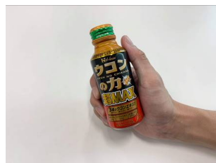
【ウコンの力 超 MAX】