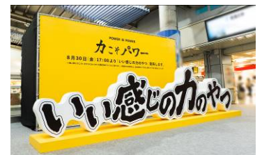
※ご参考 2019年8月実施時の様子

2019年8月、「ウコンの力」の新キャッチコピーお披露目として実施した巨大モニュメント「いい感じの力のやつ」がこの度ご好評につき超リニューアルします。2019年9月に販売開始した、これまでのウコンのカシリーズを超えるウコン成分を凝縮した新商品「ウコンの力 超 MAX」のイメージさながら、「超いい感じの力のやつ」となって待望のカムバックをいたしました。