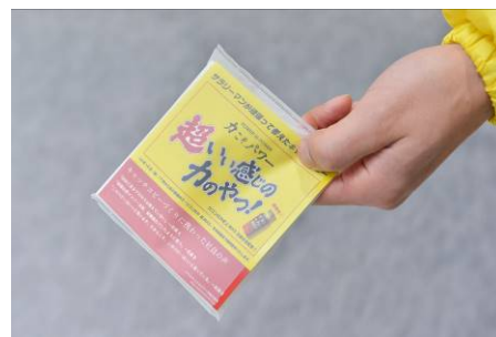
【超いい感じのティッシュ】