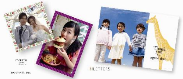
<デザイナーズプリント>

写真画像をデザインテンプレートと組み合わせる、お洒落な「デザイナーズプリント」を、企業やクリエイター等とのコラボレーションで展開していきます。今回は二つのシリーズを展開。一つ目はデザインステーションリーメーカーの株式会社マークスとのコラボレーションで実現した「masté(マステ)」シリーズです。同社のマスキングテープ「masté」ブランドから厳選した、マスキングテープと同じデザインのテンプレートで、写真をお洒落に縁取ることができ、プリントやアルバム作りが一層楽しくなります。二つ目は2014年フジカラーポストカードでご好評をいただいた、「贈っても贈られてもうれしいデザイン」がコンセプトの「LETTERS(レターズ)」シリーズです。お洒落でありながらも感謝などのメッセージ性があるデザインテンプレートを豊富に揃え、写真を「贈る」「飾る」シーンを素敵に演出します。プリントサイズは、まさかくサイズ(89mm×89mm)、Lサイズ、KGサイズ(102mm×152mm)の3種類をご提供します。