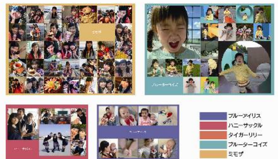
<シャッフルプリント COLOR>

ソフトウェアが画像をランダムにシャッフルして1枚のプリントに配列する「シャッフルプリント」の背景色をカラフルな5色から選べるサービス。画像を選ぶ手間が少なく、ランダムに配列される面白さから、ひと味ちがう写真プリントを楽しめるサービスとしてご好評いただいている「シャッフルプリント」の活用シーンをより華やかに演出いたします。プリントサイズは、KGサイズ(102mm×152mm)、A4サイズの2種類をご提供します。