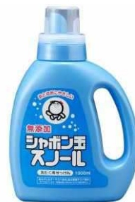
【シャボン玉スノール】