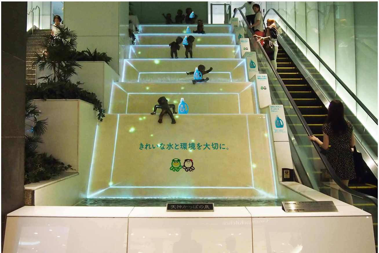
【天神かっぱの泉タイアップイメージ】