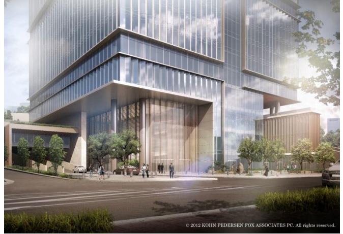
オフィス・ホテル棟 オフィスエントランス