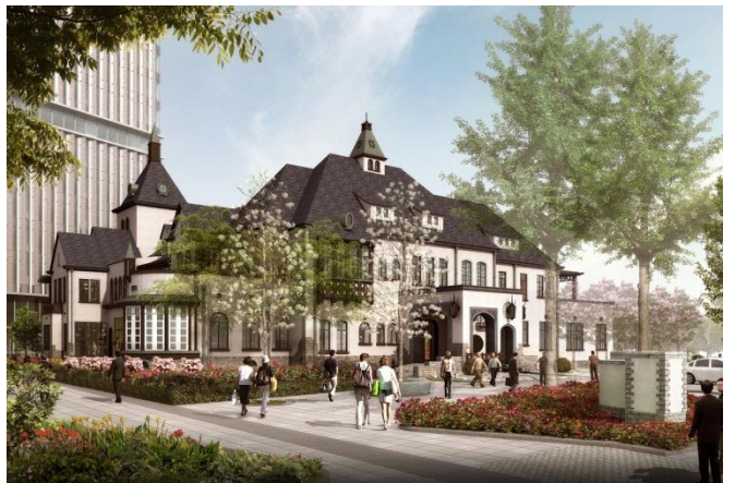
旧館保存イメージ