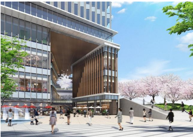
商業エントランス