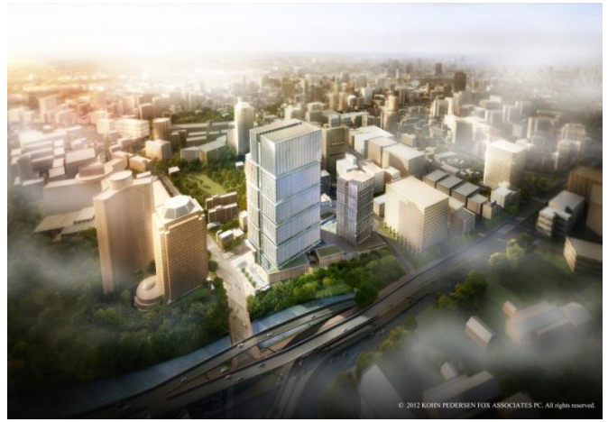
上空より本計画地を望む