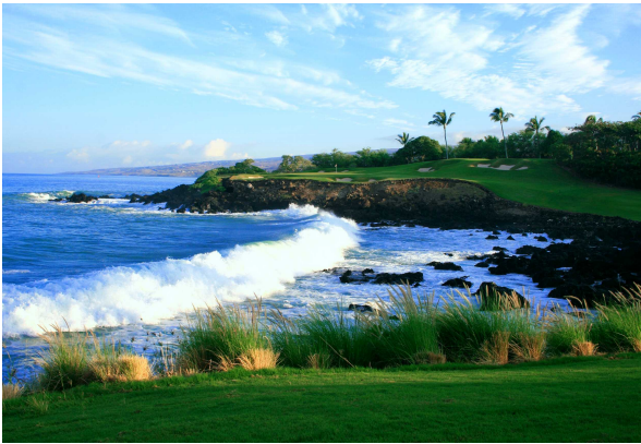
マウナケアゴルフコース