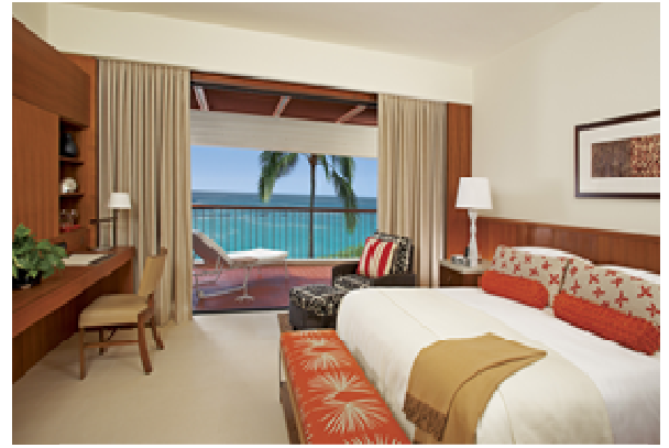
客室 (デラックスオーシャンビュー)