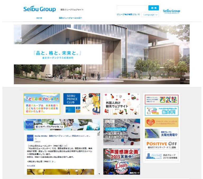
日本語サイトには西武グループ Facebook ページを設置