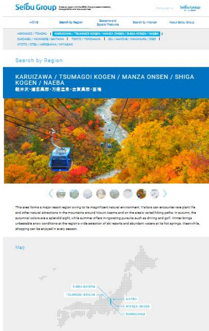
グループ施設をエリアごとに集約したページ（一部）