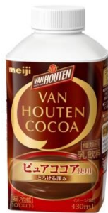
「バンホーテン ココア」(430ml) 希望小売価格:150円(税別)/162円(税込)