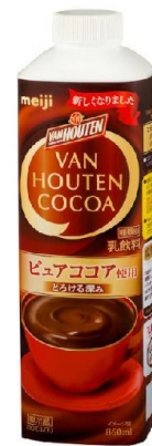
「バンホーテン ココア」(860ml) 希望小売価格:270円(税別)/292円(税込)

本商品は、180年以上にわたり、世界で愛され続けているバンホーテンのココアパウダーを100%使用したココア飲料です。これまでの「VAN HOUTEN COCOA(紙パック)」の1.5倍(100ml当たり)のココアパウダーを使用し、なめらかでとろけるようなくちどけの濃厚なココア感と、それをひきたてるミルクのあじわいをお楽しみいただけます。