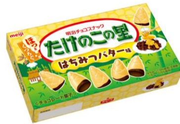
「たけのこの里 はちみつバター味」