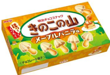
「きのこの山 メープルバニラ味」