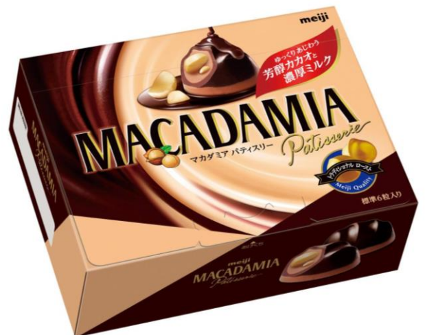
「マカダミアパティスリー」