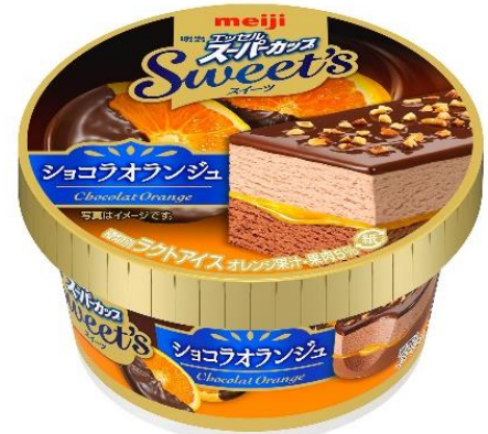
「明治 エッセルスーパーカップ Sweet's ショコラオランジュ」 メーカー希望小売価格:220円(税別)・238円(税込)

「明治 エッセルスーパーカップ Sweet's」シリーズは、アイスと素材を層状に重ねることで、上質なスイーツの味わいに仕立てあげた商品です。2016年12月より発売し、お客さまより大変ご好評いただいております。