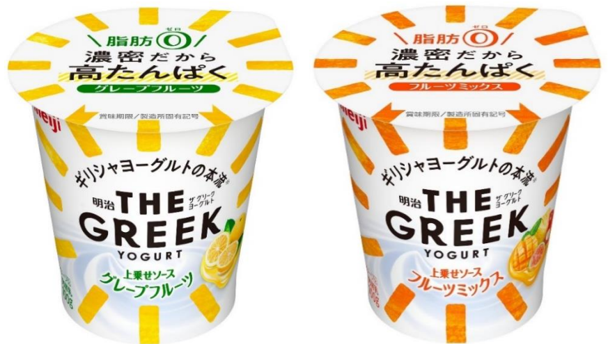
「明治 THE GREEK YOGURT グレープフルーツ/フルーツミックス」 希望小売価格:各 140 円(税別)/151 円(税込)

「明治 THE GREEK YOGURT」シリーズは、栄養とおいしさが凝縮された“ギリシャヨーグルト”です。日本で定着しているギリシャヨーグルトの濃密なおいしさに加え、脂肪 0 でヘルシーに、たんぱく質を中心とした栄養素が取れるといった新たな価値を提供しています。