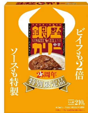
銀座カレー 25周年 特別限定品 希望小売価格:380 円(税別)/410 円(税込)

カレー市場は、共働き、単身世帯増加による個食化の進行や、調理に対する時短ニーズの増加などにより、レトルト市場がルー市場を逆転し(図)、カレーは手作りから買うものへ変わりつつあります。昭和初期の憧れの銀座モダンの世界を一皿にこめた「銀座カレー」は、このレトルトカレー市場の拡大に寄与してまいりましたが、今年 2 月に発売 25 周年を迎えます。