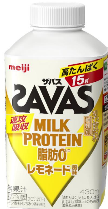
「(ザバス)MILK PROTEIN 脂肪0 レモネード風味」 希望小売価格:155 円(税別)/168 円(税込)

近年、健康志向の高まりや、スポーツ愛好家層の拡大を背景に、理想のカラダを目指して運動し、より手軽にプロテインを摂取したいというニーズが増えており、「(ザバス)MILK PROTEIN」シリーズは、2015年度売上の約10倍と大幅に伸長(グラフ1)しています。