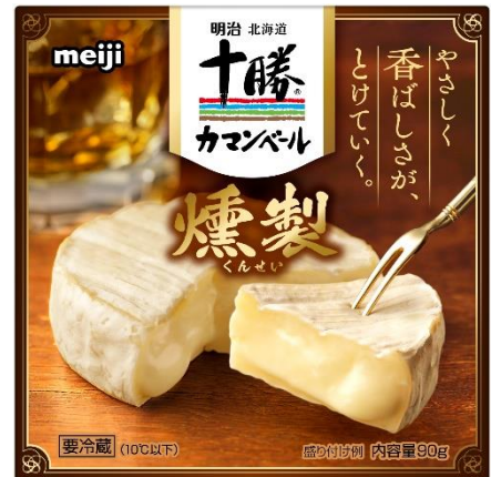
「明治北海道十勝カマンベールチーズ燻製」 希望小売価格:650円(税別)/702円(税込)

まろやか燻煙製法※により、 クリーミーな味わいとやさしい燻製香の 絶妙なバランスを実現