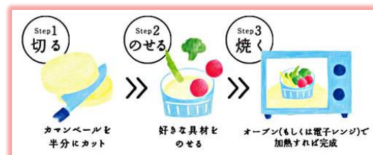
◆お料理活用「コックカマン」◆