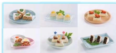
◆おつまみやオードブルに◆