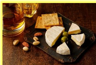
◆大人の上品時間に◆

当社の「明治北海道十勝カマンベールチーズ」は、日本人の味覚に合わせて作ったまろやかな味わいのカマンベールチーズです。現在、「明治北海道十勝カマンベールチーズ」「同切れてるタイプ」「同ブラックペッパー入り切れてるタイプ」のラインアップで展開しています。今回「明治北海道十勝カマンベールチーズ燻製」を発売し、食卓の 1 品として楽しむだけでなく、料理での活用やおつまみなど、より幅広い食シーンでお楽しみいただけます。