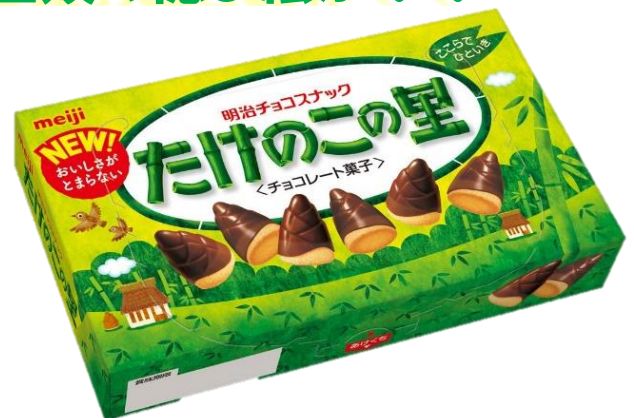
「きのこの山」「たけのこの里」