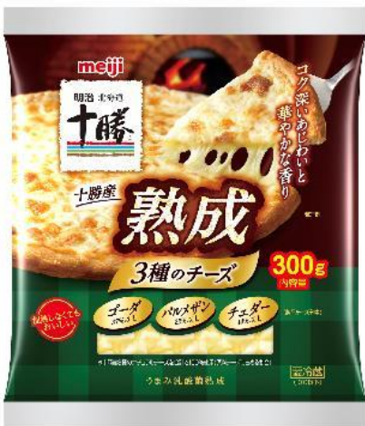
「明治北海道十勝 十勝産熟成3種のチーズ」(300g) 希望小売価格:864円(税込)