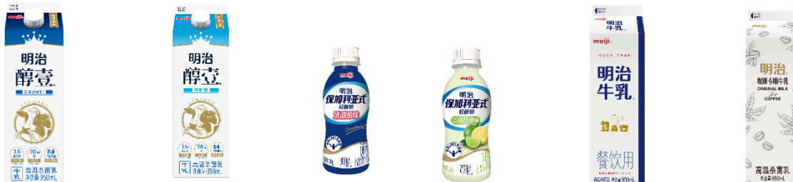
生産する商品例（左から市販用牛乳、ヨーグルト、業務用牛乳）

中国の牛乳・ヨーグルト市場は伸長しており、牛乳については賞味期限の長い常温の牛乳が主流となっていますが、近年ではチルドの牛乳が拡大傾向となっています。ヨーグルトについても、今後継続的に市場が拡大していく見通しです。明治乳業（天津）有限公司においては、現在中国で販売している牛乳・ヨーグルト商品に加え、市場のニーズに合わせた新たな商品も生産予定です。当工場の稼働により中国における牛乳・ヨーグルトの生産能力を約2倍に増強させ、拡大する市場に合わせ、より多くのお客さまへ商品をお届けしてまいります。