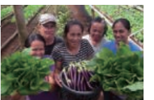
ミンダナオの現地より