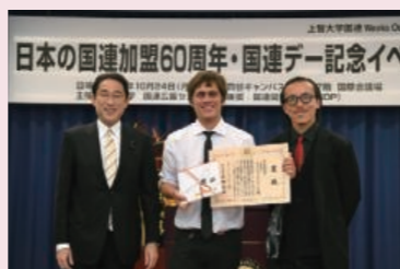
昨年の表彰式の様子

TOGETHER 賞審査チーム 国際労働機関 (ILO)、国際移住機関 (IOM)、国連難民高等弁務官事務所 (UNHCR)、 国連広報センター (UNIC)、国連児童基金 (UNICEF)、国連大学 (UNU)