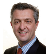
フィリッポ・グランディ氏