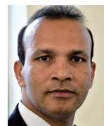
サリ・アガステイン教授