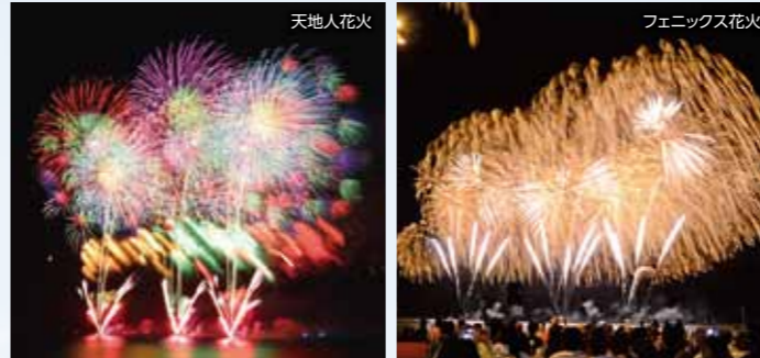
フェニックス花火

ドキュメンタリー映画“Go for Broke! -ハワイ日系二世の記憶-”特別上映