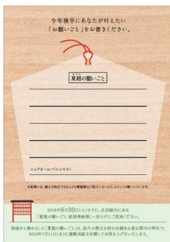
【裏面】願いごとを記入する絵馬