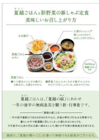
【表面】美味しいお召し上がり方