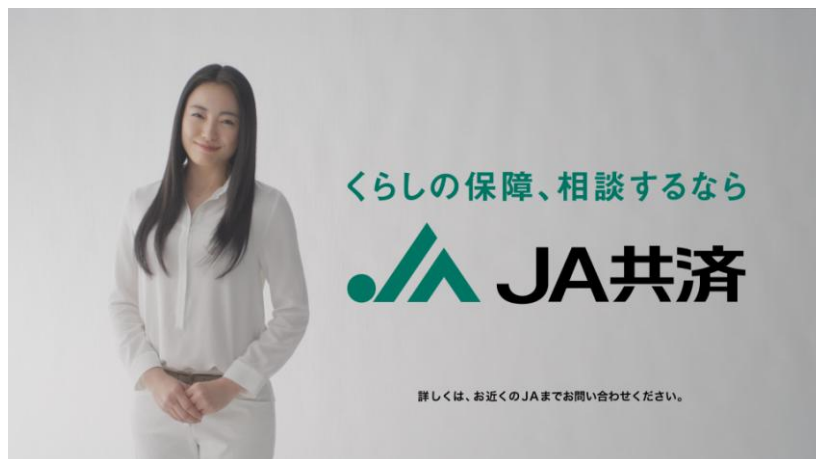
JA共済イメージキャラクター 仲間 由紀恵さん

J A共済の保障や事業の内容を解説するのは、平成25年でJ A共済イメージキャラクターを務めて14年目を迎えた仲間 由紀恵さん。『三谷家』の父親役には、NHK朝の連続テレビ小説「あまちゃん」に出演予定の尾美 としのりさん、中学生の娘役には、2011年の「第7回東宝『シンデレラ』オーディション」で、当時史上最年少の10歳でグランプリに輝いた上白石 萌歌（かみしらいし もか）さんを起用しました。優しく照れ屋な尾美パパと、キュートな萌歌さん父娘の姿は見る人を幸せな気持ちにしてくれます。大人気女優仲間由紀恵さんをはじめ、実力派俳優の尾美としのりさん、新人女優の上白石萌歌さんが揃う見どころ満載のCMシリーズに仕上がりました。