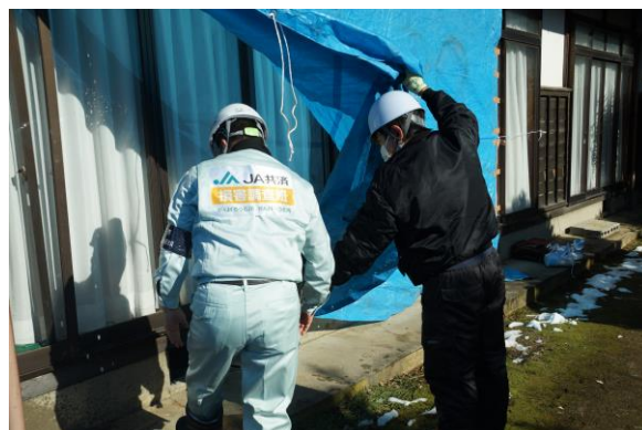
損害調査の様子（本年1月に石川県にて撮影）