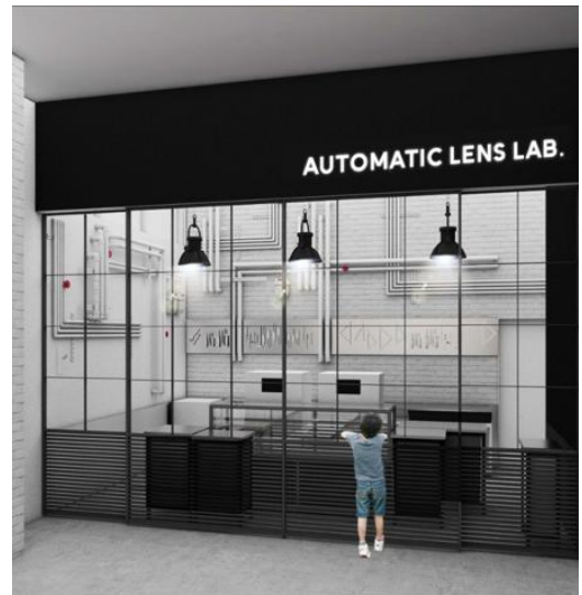
西日本初となる 『JINS AUTOMATIC LENS LAB.』外観