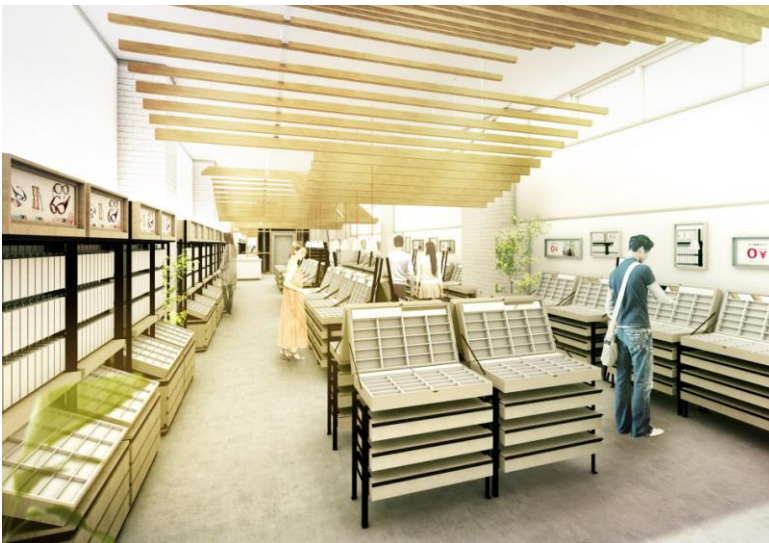
JINS 国内店舗史上最大規模を誇る「JINS 広島本通店」内観

同店舗は西日本では初となるレンズ加工のオートメーションシステム『JINS AUTOMATIC LENS LAB.(ジズオートマティックレンズラボ)』を店舗内に備えた最先端のアイウェアショップであり、また、JINS国内店舗史上最大の規模を誇る店舗となっております。