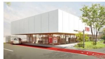
「JINS パワーモール前橋みなみ店」外観