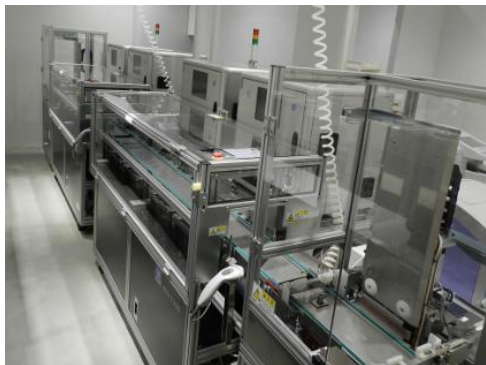
『AUTOMATIC LENS LAB.』前面