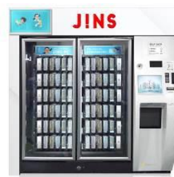
メガネ自動販売機「JINS Self Shop」

JINS は、今後も既存の手法に捉われない次世代型の店舗オペレーションの確立を通じて、お客様に新しい付加価値を提供してまいります。