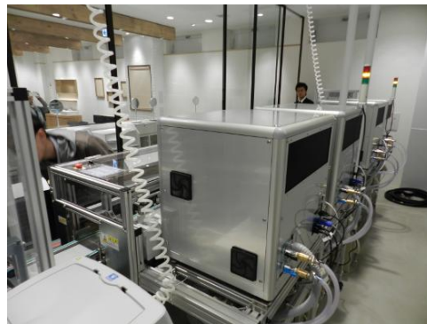
『AUTOMATIC LENS LAB.』背面

※写真は JINS 吉祥寺ダイヤ街店のものであり、一部広島本通店の設備とは異なります。