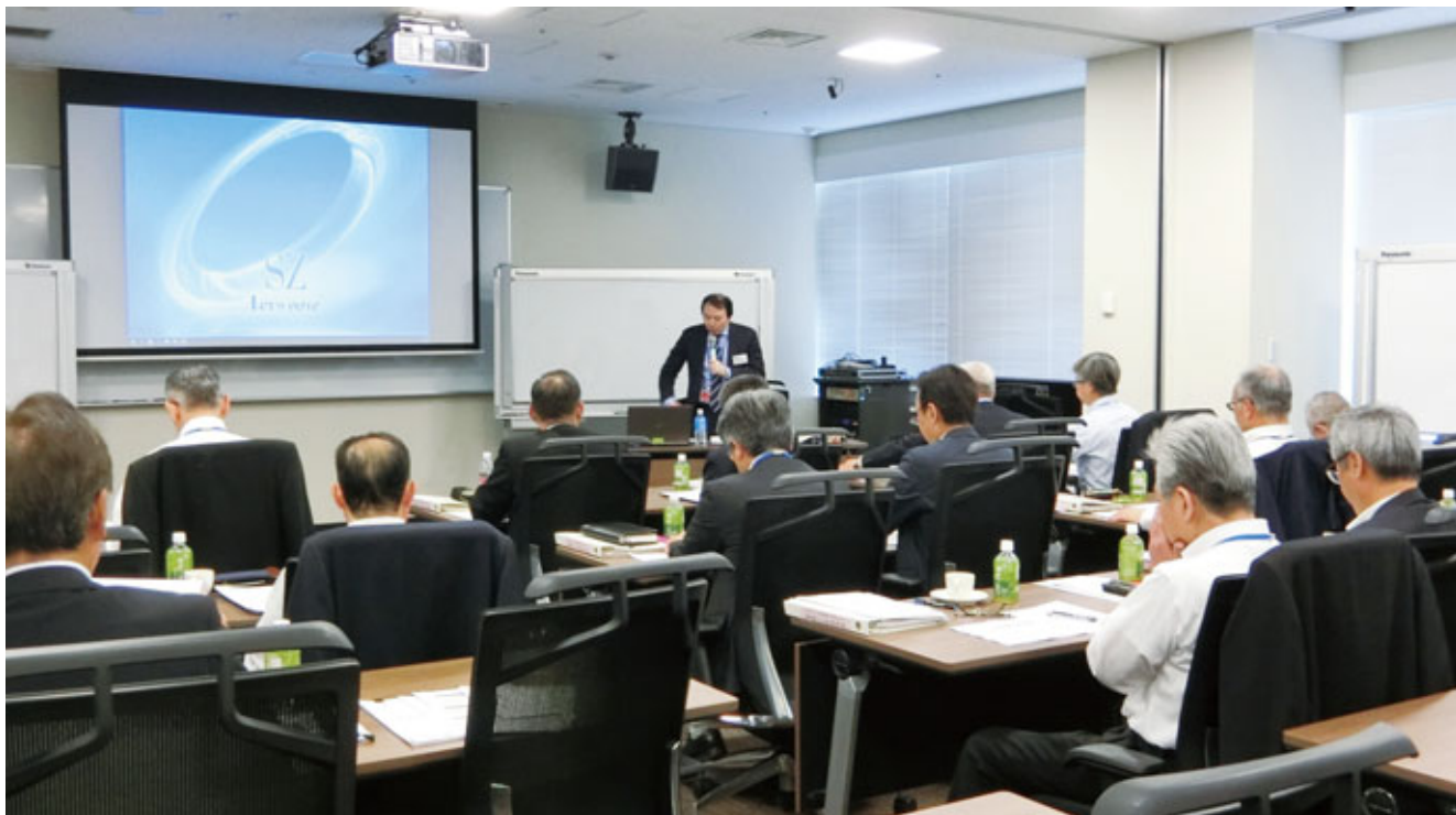
JAバンク中央アカデミー「経営者コース」での講義風景

大きな環境変化のなか、利用者の目線に立った変革を進めるJAグループ。同グループの“人材育成センター”として変革リーダーの育成を目指し、全国のJA経営者を対象に研修を行う農林中金アカデミーについて紹介する。