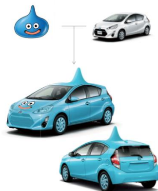
Webサイト「配合シミュレーター」より スライム配合アクア